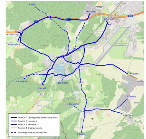
Abbildung 1: Radrouten des Alltagsradrouthenetz STA in der Gemeinde Weßling [umap.openstreetmap.de]

Das im Jahr 2016 erstellte Konzept für ein Alltagsradrouthenetz für den Landkreis Starnberg wurde am 17.10.2016 einstimmig vom Kreistag beschlossen und am 25.07.2017 dem Gemeinderat vorgestellt. Die darin definierten Radrouten (Abbildung 1) stellen vollständig das Radverkehrsnetz in der Gemeinde Weßling dar. Da sie alle bedeutsamen innerörtlichen und interkommunalen Verbindungen abdecken sind darüber hinaus gehende Radrouten nicht erforderlich. Insbesondere sind die meisten Wohnstraßen der Gemeinde als 30-Zone oder verkehrsberuhigter Bereich ausgewiesen, sodass sie bereits attraktiv und sicher für den Radverkehr sind und in der Regel kein Handlungsbedarf besteht.