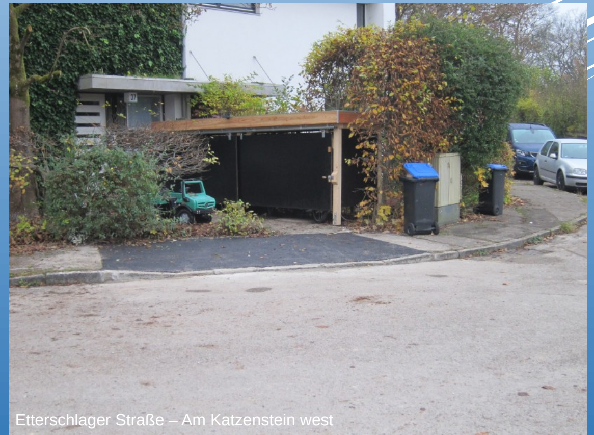
Etterschlag Straße – Am Katzenstein west