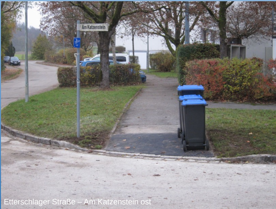
Etterschlag Straße – Am Katzenstein ost